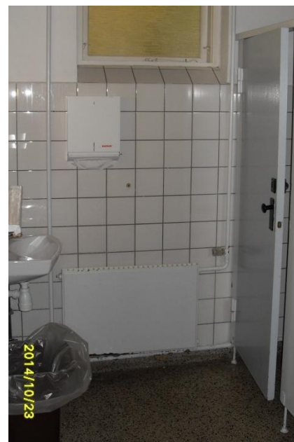
B Håndvask på dametoiletet og dør til toiletkabine