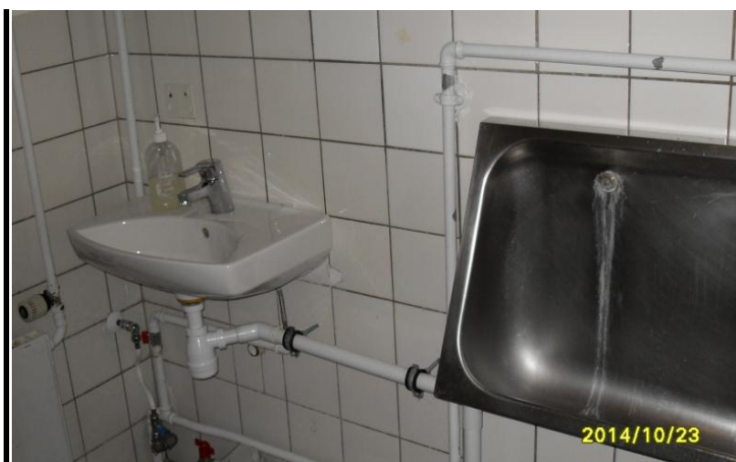
C Urinal og håndvask på herretoiletet