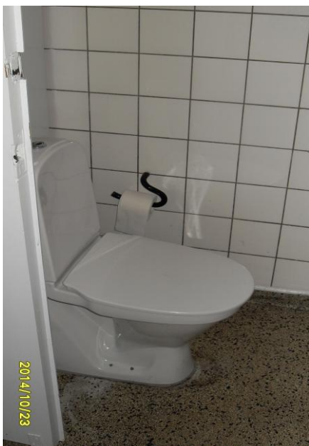
A Trange forhold i toiletkabine